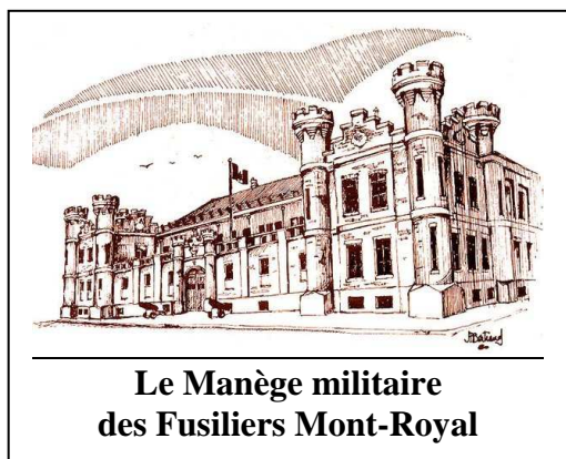
Le Manège militaire des Fusiliers Mont-Royal

Après la Deuxième Guerre, les Fusiliers Mont-Royal redeviennent une unité de la Réserve et au début des années 1950. Ils renflouent les rangs du Royal 22 e Régiment , durant la Guerre de Corée. Ils prendront part également à création de la brigade canadienne stationnée en Allemagne durant la guerre froide.