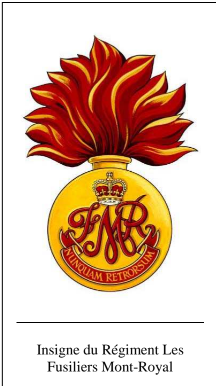
Insigne du Régiment Les Fusiliers Mont-Royal

Les Fusiliers Mont-Royal forment le plus vieux régiment canadien-français de Montréal. Son histoire s'étale sur presque un siècle et demi. Tant par ses honneurs de bataille que par ses héros, il fait partie intrinsèque du patrimoine militaire canadien. Notre unité, membre de la Force de réserve est formée de citoyen-soldats.